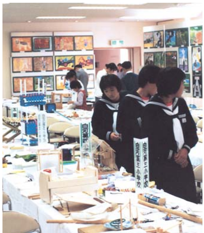
白河アーカイブズ (過去の記憶)