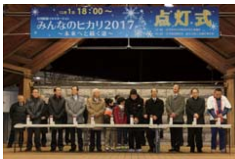
昨年のイルミネーション点灯式