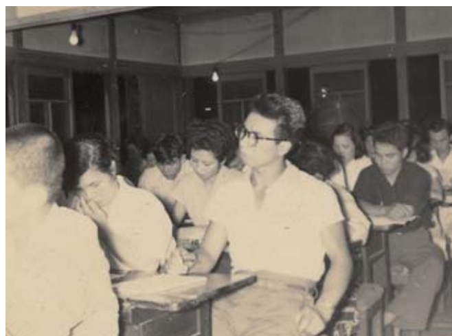
簿記講習会の様子 (撮影時期：昭和30年8月1日)