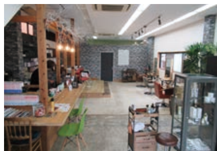
洗練された店内の様子