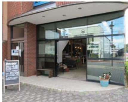
ガラス張りが目を引く外観

まずは地域での美容室としての基盤をしっかりすることが大切だと考えています。また、お客さんや来てくれる人とのつながりの中で生まれた発想は、なんでも挑戦したいと考えており、お店でのゲームイベントや、お花屋さん、クッキー屋さんとのコラボレーションの構想を練っています。お店の名前の通り、気軽に寄り道もらえるお店を追究し、楽しい空間と時間をお客様と一緒に造っていきます。