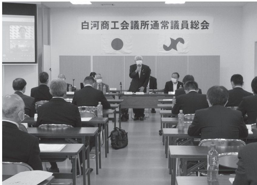
白河商工会議所通常議員総会