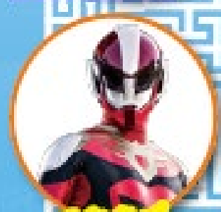
ウルトラマンが やってくる！