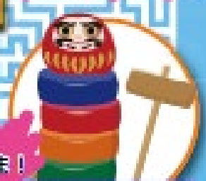
巨大だるま落とし