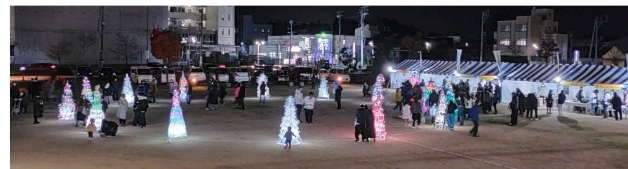
▲(参考)令和5年度ペットボトルツリー