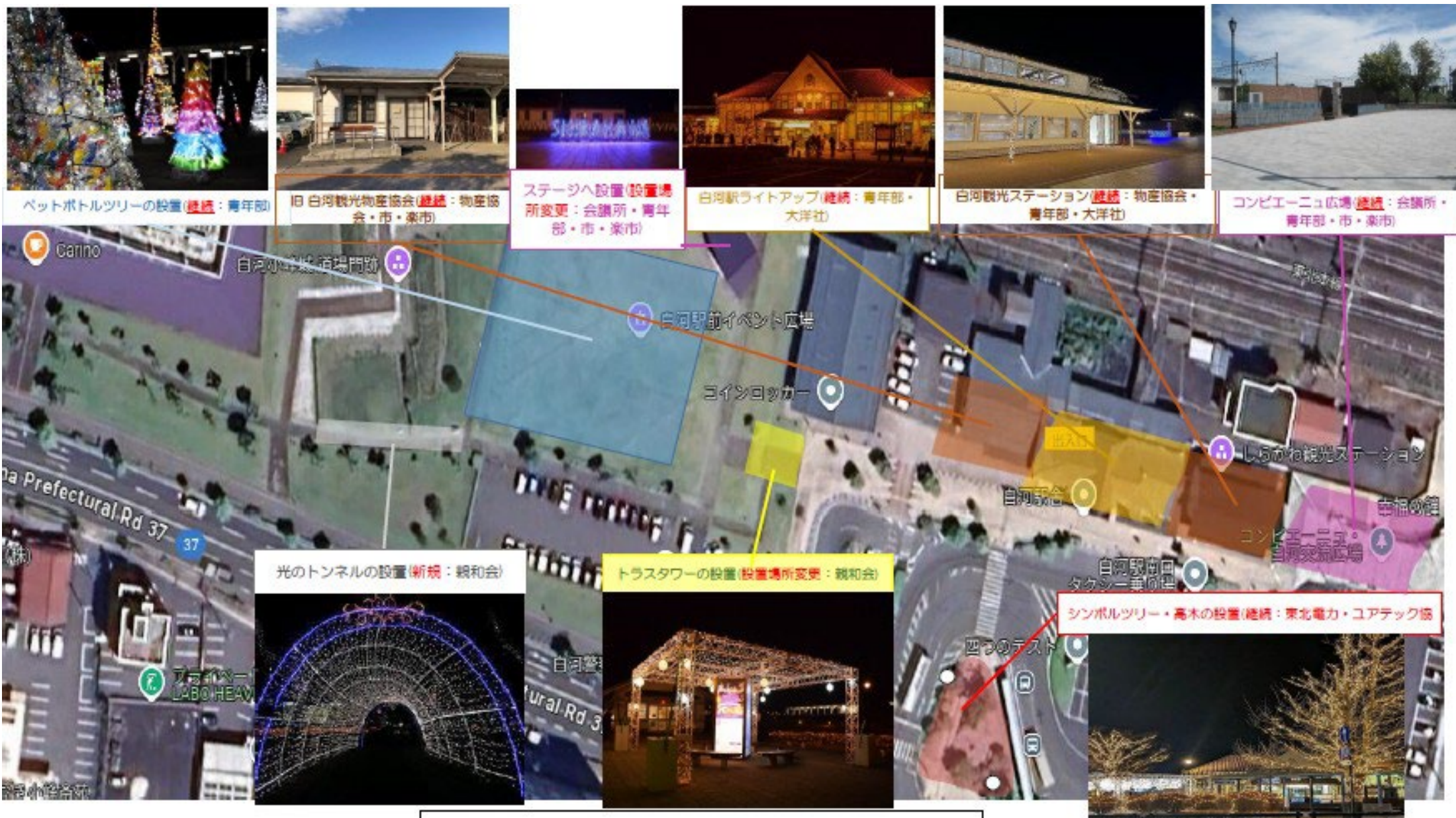
令和6年度 白河駅前イルミネーション実施図面