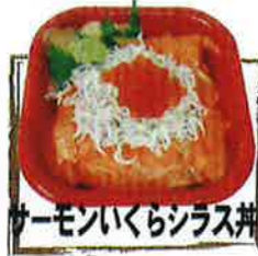
サーモンイクラシラス丼