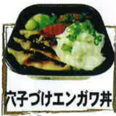
穴子つけエンガワ丼