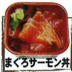
まぐろサーモン丼