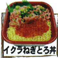
イクラねぎとろ丼