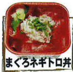
まぐろネギトロ丼