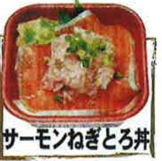
サーモンねぎとろ丼