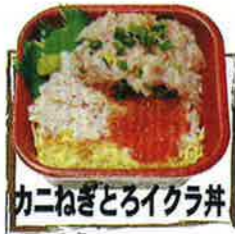
カニねぎとろイクラ丼