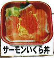
サーモンイクラ丼