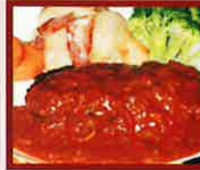
ハンバーグ ▲デミグラスソース or 和風ソース