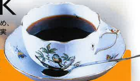
タントウブレンドコーヒー ※ご希望の挽き方をお申し出下さい。