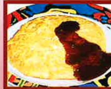
オムライス ▲エビ、ベーコン、玉ねぎの入った ケチャップ味のライスをお皿に 玉子で包みデミグラスソースを かけました。