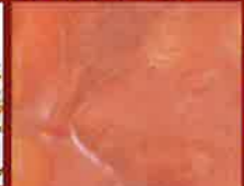
タントウライトセット ●パン ●玉子料理 ●サラダ ●ソーセージ ●コーヒー or 紅茶 or ミルク