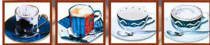
ワインナコーヒー エスプレッソ カフェオレ ココア