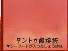
タントウ風味飯 ▼シーフードが入ったしょうゆ味