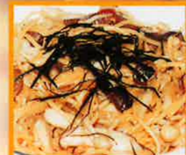
ピリカラスパゲティ ●しめじ・しいたけ・えのきがいった和風味