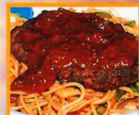
バーグスパゲティ ●デミグラスソースでボリュームたっぷり