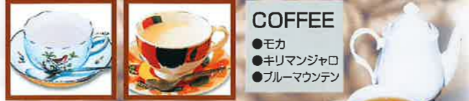
ロイヤルミルクティー ホットミルク 紅茶 (ポット)