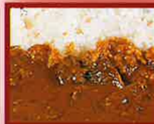
各種カレー ▲じっくり煮込んだ本物の味 (シーフードカレー) (ビーフカレー) (チキンカレー)