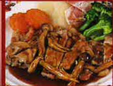
ポークソテー ▲タントウ特製デミグラスソース