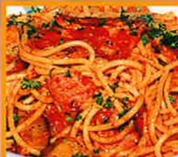
ナス&ベーコン ●さっぱりトマト味