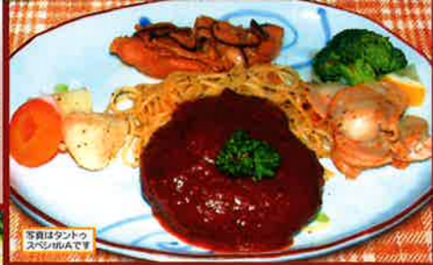
タントウスパシャル (Aセット) 魚のピリ辛ソースがけ・ミニハンバーグ・ 焼立のバター焼き・野菜の付け合わせ (Bセット) 牛肉のワイン煮のピリ辛ソースがけ・ 焼立のバター焼き野菜の付け合わせ