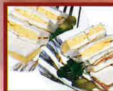
サンドウィッチ ▲玉子 (焼豆腐風味で好) ▲ミックス (玉子と野菜とチーズ)