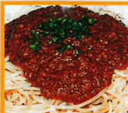
ミートソース ●牛肉たっぷり