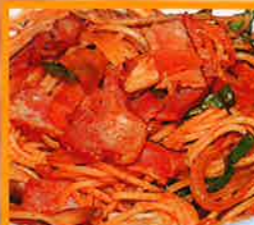
ナポリタン ●特製ケチャップ味