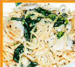
帆立とほうれんそう ●生クリームの濃厚な味です。