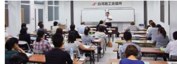
簿記講習会の様子