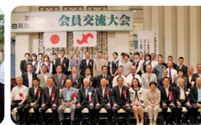
優良従業員表彰式