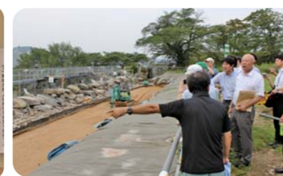
部会の勉強会の様子