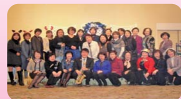
クリスマス親睦会の様子

女性経営者・役員・従業員をメンバーとし、女性の立場からの商工業の発展や福祉の増進を目指して活動しています。