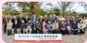
部会活動への参加

業種の特性に応じた部会に所属し、各業界の活性化に向けた要望の取りまとめ、研修会などを行っています。