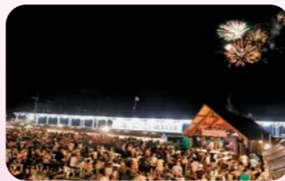
青年部夏の恒例イベント

会員事業所の若手経営者等で構成され、地域経済の振興や経営研究を目的に活動しています。