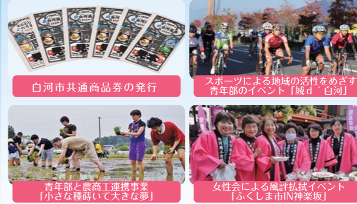
白河市共通商品券の発行