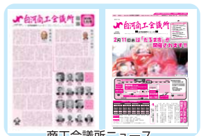
商工会議所ニュース

各種制度やセミナー、イベント等の紹介、会員事業所紹介の特集記事等を掲載し、広告や折込チラシ等のサービスも行っています。