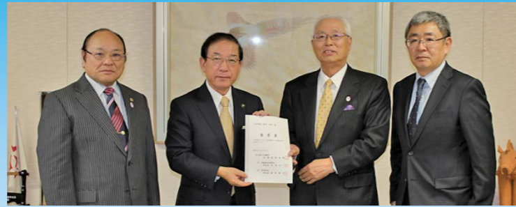
白河市長に、年末年始市内飲食店の利用要望書の提出

一企業では、解決できないような経営上の問題（法律や税制など）、地域の問題（産業構造、職業教育など）について、会員の意見を集約し、国、県、市等に対して政策提言、要望活動を行っています。