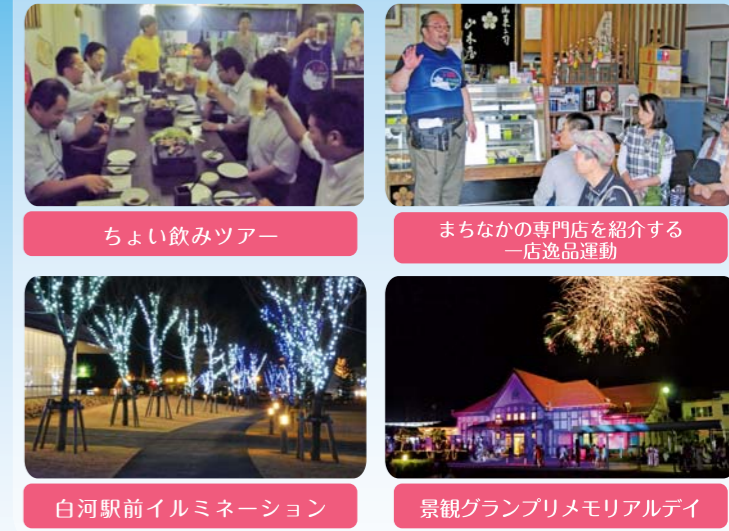
ちよい飲みツアー