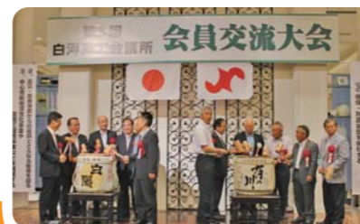
親睦を深める会員交流大会