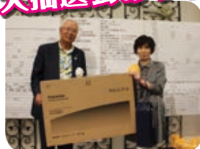
過去の大抽選会の様子

白河商工会議所では、会員の交流を図るため、「会員交流大会」と「ゴルフ大会」を開催いたします。 今回の会員交流大会でも、毎年ご好評いただいている大抽選会など多彩なお楽しみ企画を用意しています。 多くの会員事業所の皆様の参加をお待ちしております。 ※詳細は折込チラシをご覧ください。