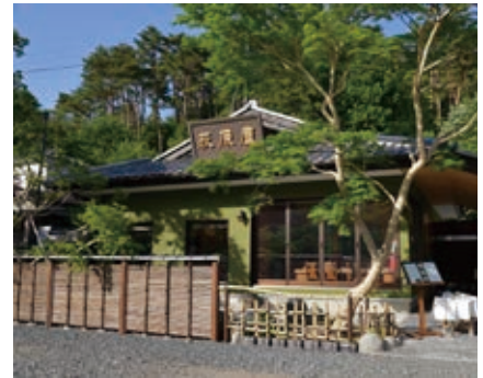
リニューアルオープンした外観

今までの人とのつながりを大切にしながら、地元の人に愛され身近に感じてもらえるようマルシェを開いたり、お店でできるライブなどのイベントを企画したいと考えています。