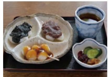
人気の「南湖だんご」は変わらない味