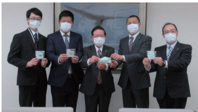
白河市長へ園児用マスクを手渡しました