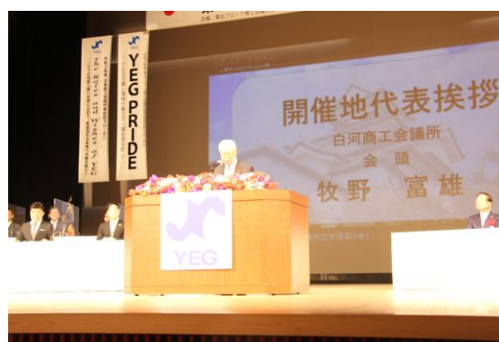
記念式典でのPRの様子