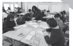
実践的なセミナーの開催