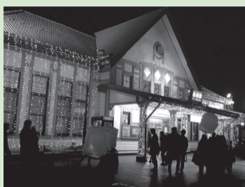
白河駅前イルミネーション

魅力あるまちづくり、地域・産業の振興に向けて商工業・観光、イベント等の地域経済の活性化に取り組めます。