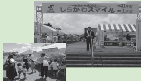
夏のイベントの開催