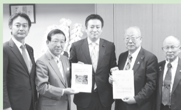
4号4車線化整備促進に関する要望

地域を代表する総合経済団体として、地域問題・経済問題の解決に向け、国・県・市・関係機関に対し要望・提言活動を行い実現を図ります。