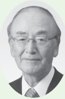
日本商工会議所会頭 三村 明夫

明けましておめでとうございます。2022年の新春を迎え、謹んでお慶び申し上げます。