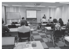
定期的に創業塾を開催