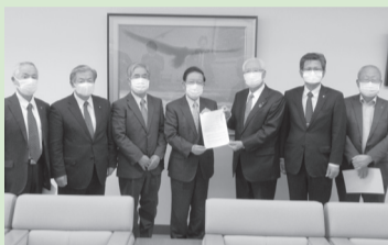
コロナ禍での経済活動への要望