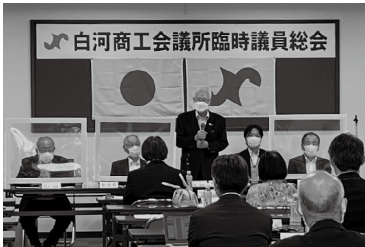
第1回臨時議員総会の様子

8月25日(木)、新白信ビルにおいて、令和4年度第1回臨時議員総会を開催いたしました。 牧野会頭はじめ役員・議員68名(うち委任状行使者32名)が出席しました。報告事項としては会員加入、議員改選関係など、計11項目が報告されました。続いて、議事として「2号議員(部会選出議員)の部会別議員定数の同意について」が審議され、原案通り承認されました。