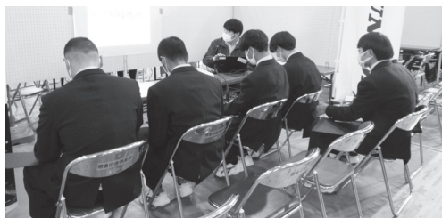
参加した生徒たちの様子

11月25日(金) 棚倉町総合体育館にて令和4年度ふくしま県南地元企業説明会を開催致しました。 県南地域の求人企業68社が参加し、同地域内3校の高校生約360名が来場しました。 今回ご参加くださいました事業所の皆様、ご協力をいただき誠にありがとうございます。