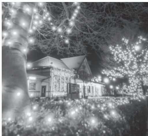
前回のグランプリ作品