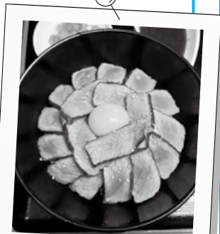
ランチ限定 サロインステーキ丼

平日はお得なランチも営業中! 誕生日のお祝いは「バースデー 肉ケーキ」も承ります(表紙写真)