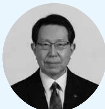
議員 鈴木 一男 氏