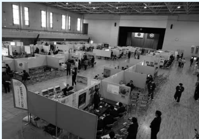
昨年の企業説明会の様子

「令和5年度ふくしま県南地元企業説明会」を令和5年11月21日（火）棚倉町総合体育館にて開催いたします。本事業は、地元就職を希望する県南地域の地元高校生と新規高卒者の採用意向がある県南地域の求人企業とのマッチングの場を創出することを目的としています。