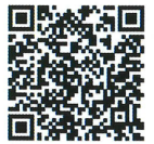
講座修了生のポートフォリオ