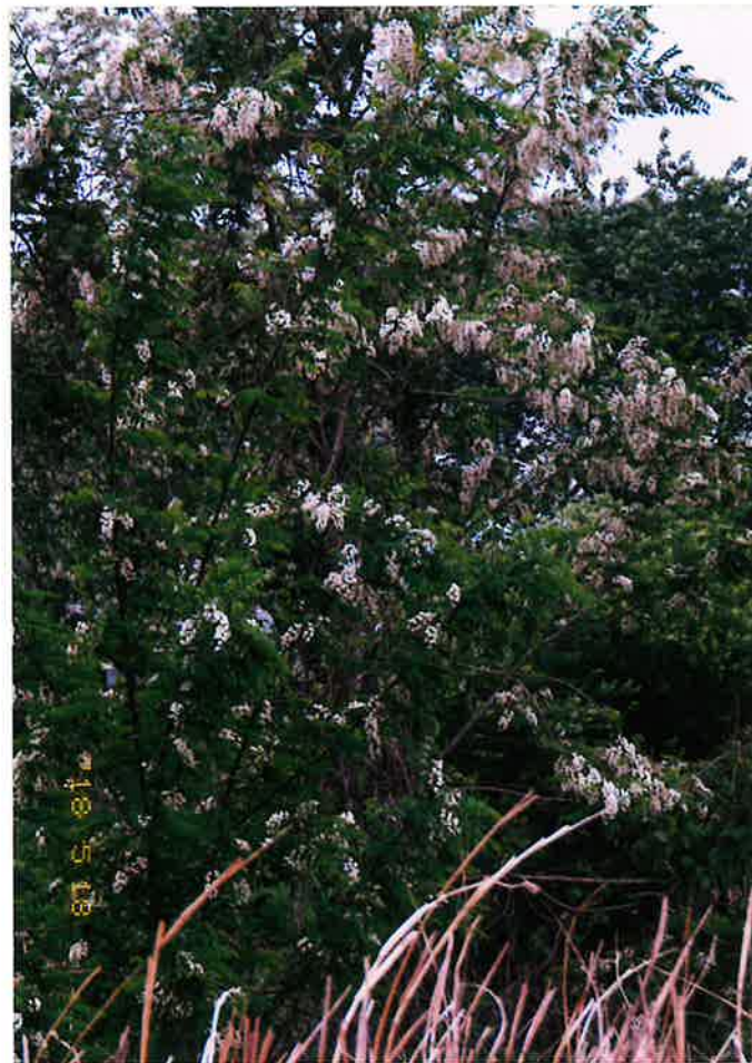
アカシアの花と樹木