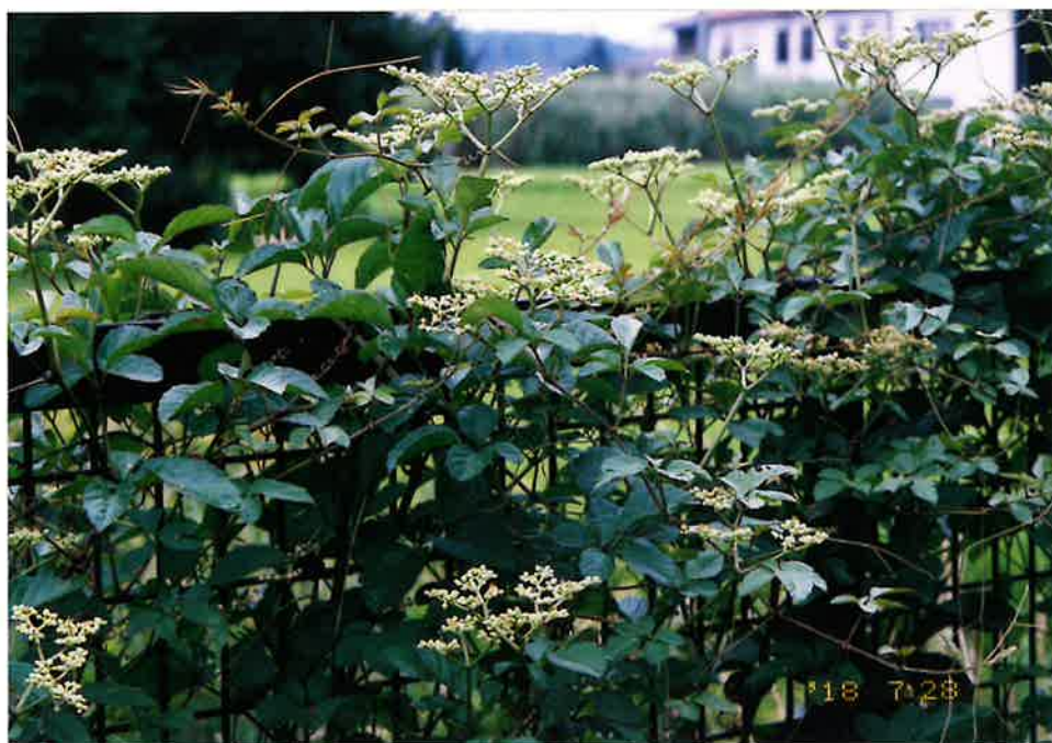
かじ(上段) フェッカーベリー (アジア、アメリカ、オセアニア原産) " (中、下段) パーソシツカス シュガーバイン (オランダ、園芸種) Botanical Asian Garden さま