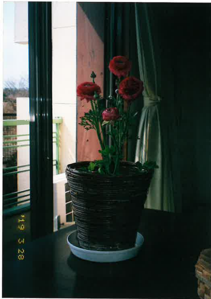
うナンキエス (園芸種 原産不明)