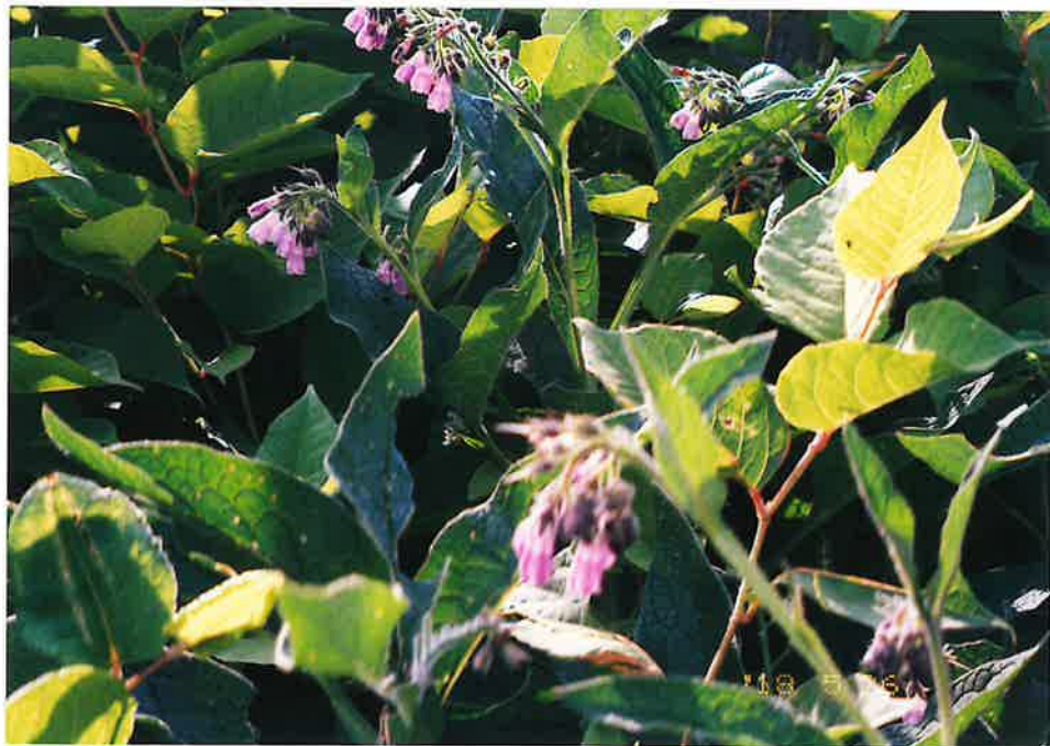
クレハリソウ (ヨーロッパ ~ 小アジア、日本 原産)