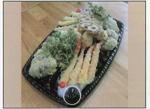
天ぷら盛り合わせ 4人前 3,000円（税込） 海老天、ちくわ天、とり天など 天ぷら6種の盛り合わせ