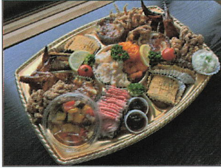
オードブル 6-7人前 7,500円（税込）

ローストビーフ、手羽先、マリネ、 エビチリ、エビマヨ、ミニグラタン、 卵焼き、唐揚げ、イカげそ、 アジ南蛮漬け など 計11品