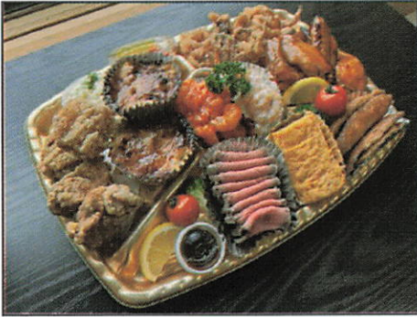
オードブル 4-5人前 5,500円（税込）

ローストビーフ、手羽先、マリネ、 エビチリ、エビマヨ、ミニグラタン、 卵焼き、唐揚げ、イカげそ、 アジ南蛮漬け など 計11品