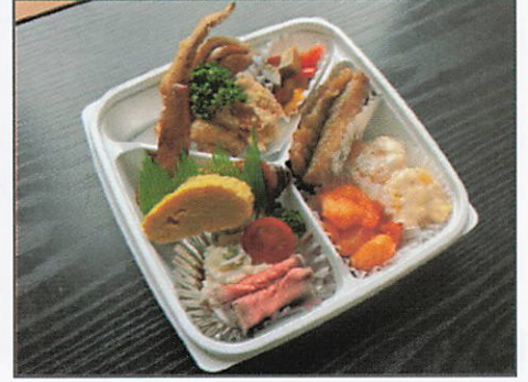
ミニオードブル 1,600円（税込）

ローストビーフ、手羽先、マリネ、 エビチリ、エビマヨ、卵焼き、 唐揚げ、イカげそ、 アジ南蛮漬け など 計10品