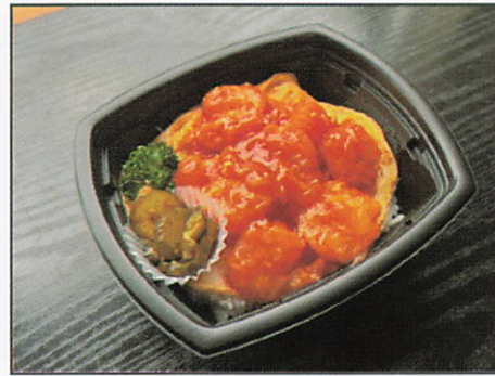
エビチリ丼 850円（税込）